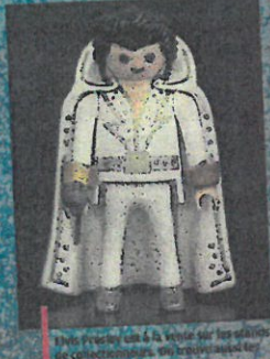
Une Playmobil est à la vente sur les stands de collectionneurs. On trouve aussi les autres figurines.