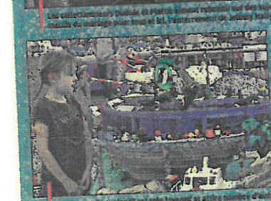
Le diorama "Apocalypse" est très apprécié et attire beaucoup d'enfants. Au centre, la remise à son classement par les collectionneurs de la réanimation à l'hôpital de sa réanimation par l'association "Deklick" afin d'aider les enfants à mieux appréhender leur entrée dans ce service. La mise en scène sur le thème des quatre saisons était imaginative et poétique.