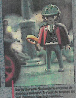
Sur le diorama de dernière époque de "Sherlock Holmes", il s'agit de trouver les huit figurines Sherlock Holmes.